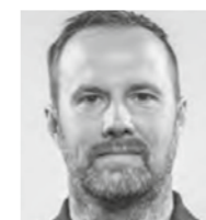
Sebastian Sanden Haustechnik