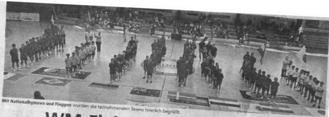
Mit Nationalhymnen und Flaggen wurden die teilnehmenden Teams feierlich begrüßt.