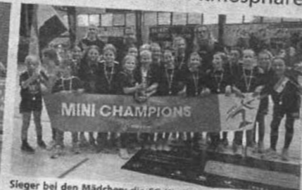
Sieger bei den Mädchen: die SG Kirchhof als Vertreter Ägyptens.

Am Samstag starteten die Jungs, am Sonntag die Mädchen am Ball. Das Besondere bei diesem Format, das der HHV nun bereits zum dritten Mal veranstaltet hat, ist, dass die Vereine im Vorfeld Nationalmannschaften zugewiesen bekommen, die dann vertreten. Und so erlangen zum Turnierbeginn Morgen jeweils zum „Einfluss der Nationen“ die Nationalhymnen und die Mann-