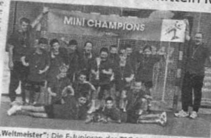
„Weltmeister“: Die E-Juniorinnen der TSG Münster als Vertreter Frankreichs.

Offenbach – Ungewöhnliche Bilder gab es am Wochenende in der Bürgeler Sportfabrik. Auf den Tribünen saßen Fans in Kängurukostümen mit australischen Flaggen neben dänischen Wikingern. Von der anderen Seite der Halle erschallte ein „Aller les bleus“ und neben den Fans mit der Tricolore im Gesicht saßen Spielerinnen und Anhänger, die die brasilianischen Nationalfarben in ihre Zöpfe eingeflochten hatten. Die TSG Offenbach-Bürgel hat die „Mini Handball Championships“ des Hessischen Handballverbandes ausgerichtet. Bei diesem Turnier trafen die besten weiblichen und männlichen E-Jugendteams (Jahrgänge 2015 und 2016) aus Hessen aufeinander, um ihren „Weltmeister“ zu ermitteln.